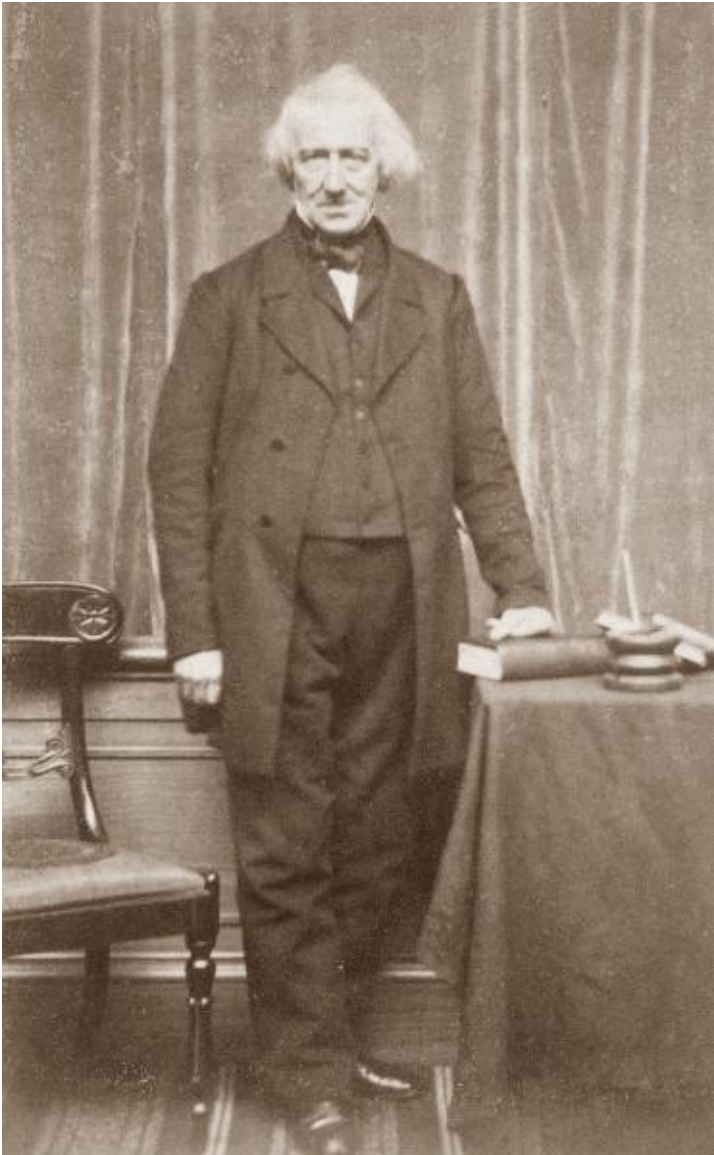
Jacob van Lennep